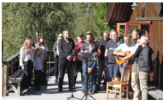
Her er hele gjengen fra Reto med i sangkoret