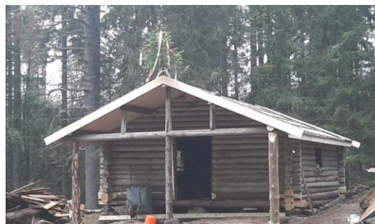
Bildet viser når hytta var under tett tak, kranselaget ble holdt på Rælingen bygdetun

Høsten 2021 ble det utført et stort arbeid med å restaurere kommunehytta i Rælingen. Etter flere tiår med forfall var det på tide å gi den et løft.