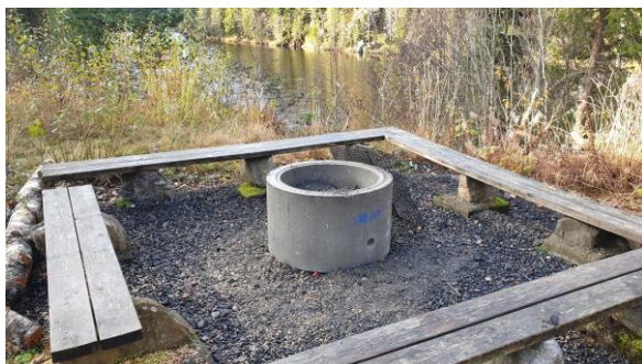
Ny ring på bålplassen ble satt opp høsten 21