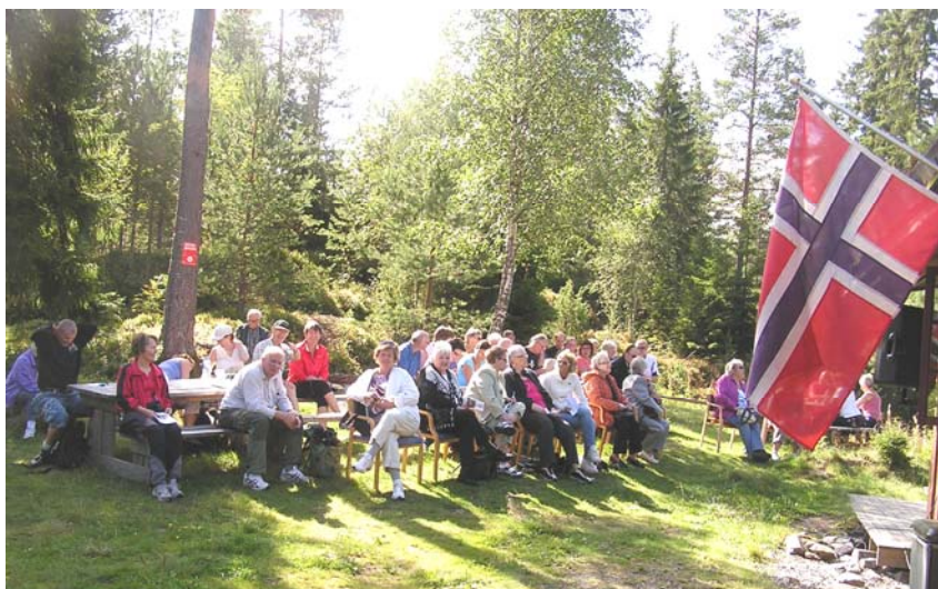
Flagget i forgrunnen, på stoler og benker vi ser noen av stevnedeltagerne