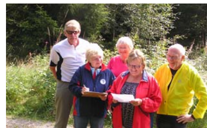
Ett av lagene på post 2, alt riktig?