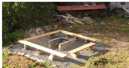
Den nye bålplassen sett fra verandaen