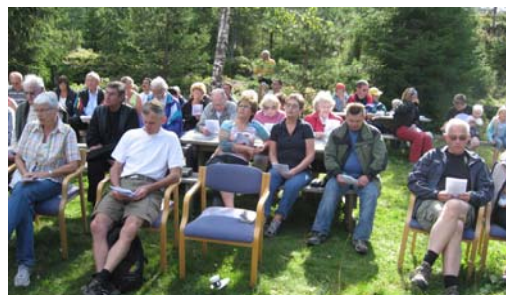
Flere bilder fra Blåbærstevnet