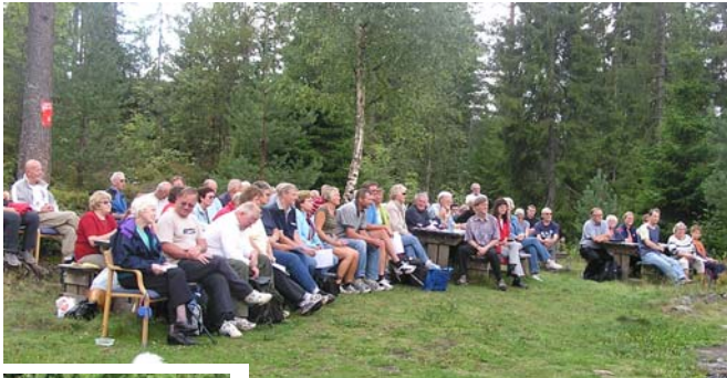
En stor forsamling ved stevnestart