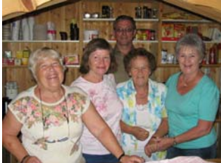
En blid kjøkkengjeng