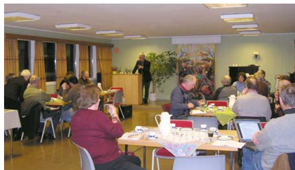
Det var ca 20 personer tilstede under stiftelsens årsmøte på Betania Lørenskog