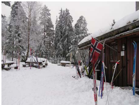
Det var mange par ski utenfor stua på åpningsdagen 1. febr. Det var bra løyper, passe kaldt men ikke sol.

En stor takk til alle som gjør det mulig å holde stua åpen. Alt arbeid er basert på frivillighet og dugnad. Vi håper på at alle de mange og gode tilbakemeldinger fra fornøyde gjester gjør at innsatsen føles meningsfylt og gir glede etter kanskje en slitsom dag..