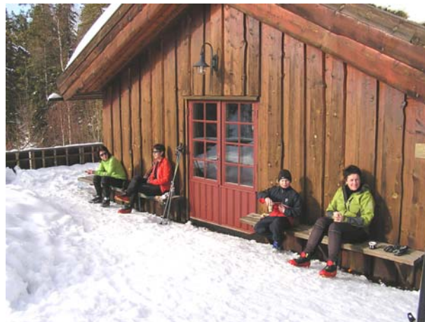
Fra søndag 15. mars, solen varmer i sørveggen.

- Vi kom langt etter stengetid, men kom inn allikevel. Takk til en hyggelig betjening.