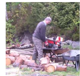
Per jobbet med kløyver