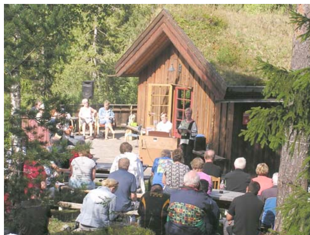
Forsamlingen hygger seg utenfor Stua