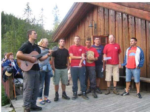
Våre venner fra Reto sang og spilte for oss