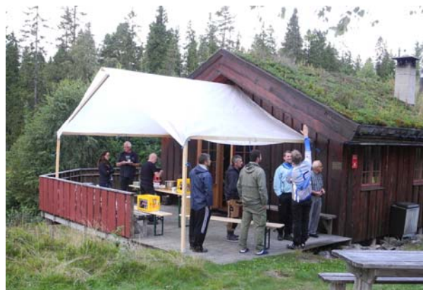
Regntaket over verandaen lunet noe for vær og vind