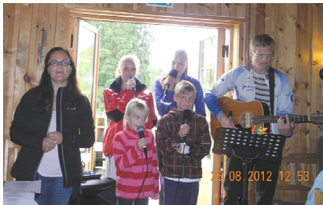
Hele familien Hykkerud deltok med sang og musikk