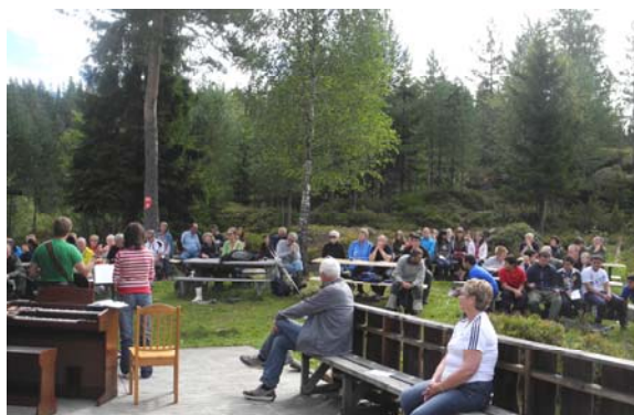
Det var godt med folk ved de fleste benker og bord