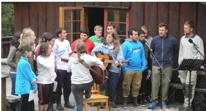
Den store gruppen fra Reto fremførte sanger med innlevelse og glede.