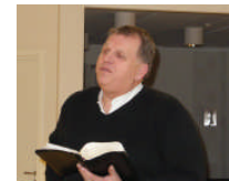
Diverse bilder fra årsmøtet.