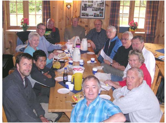
En stor dugnadsgjeng i år. Midt på dagen kom det en regnbyge og da passet det med en velfortjent matpause

Tusen takk og hjertelig velkommen igjen en annen gang.