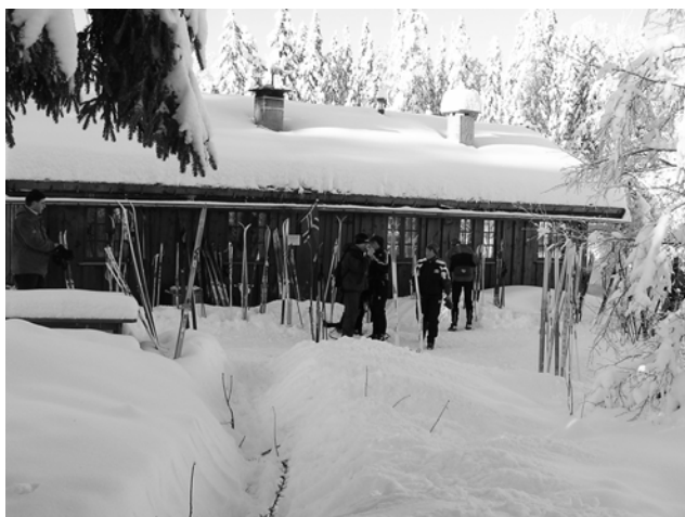
Fra en av de fine skisøndagene i vinter, ganske fullt av ski og staver utenfor stuedøra.

Ikke bare at vi nå har nye kart for salg til rimelig pris, men vi har bokstavelig talt kommet på kartet for alvor. Mange nye har funnet veien til Setertjernstua for første gang.