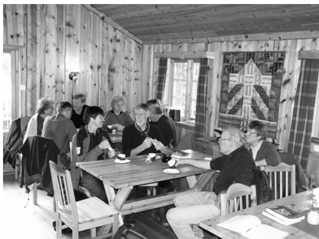
I stua er det godt å sitte ned og prate sammen !