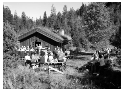
Fra Blåbærstevnet 2003

Kollekt til rehabiliterings- arbeid av rusmisbrukere.