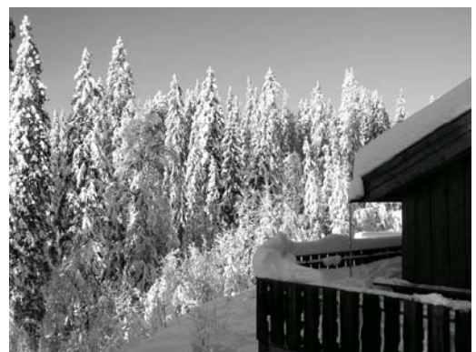
En fin vinterdag ved Setertjernstua. Naturen er kledd i sin vakreste skrud.