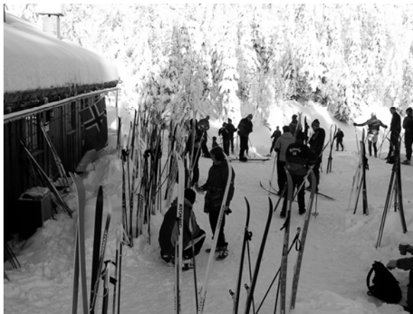
Det var folksomt ved stua på åpningsdagen.

1. februar startet vi formelt og fikk ca 300 besøkende! Vi stekte vafler og kokte kaffe mv så vi var nære ved å sprengte kapasiteten på dieselaggregatet.