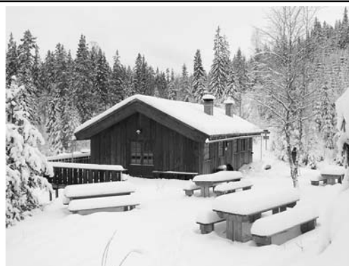
”Endelig vinter ved Setertjernstua også”