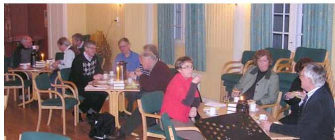
Her sees en del av forsamlingen