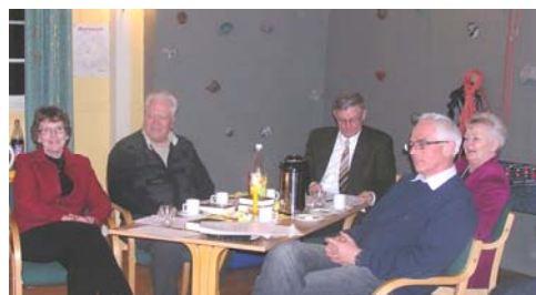
Her har vi enda et bord med deltagere.