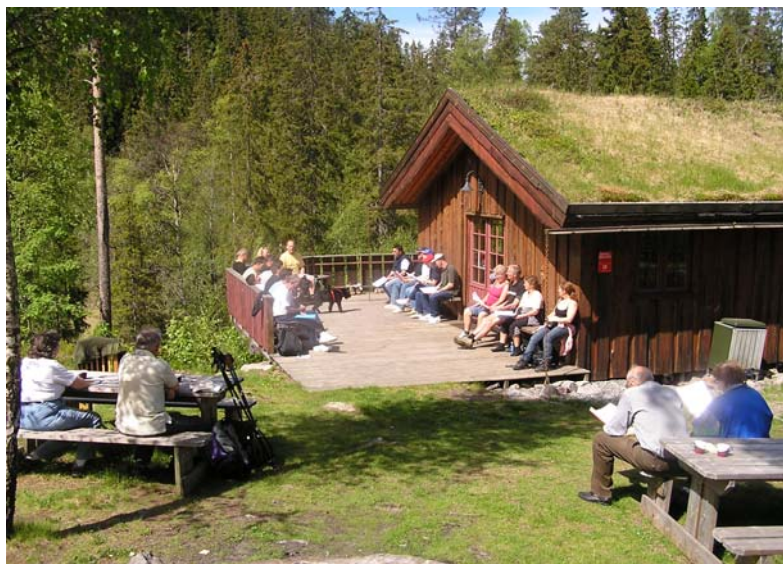
Det var godt å være tilhører på 1. pinsedag