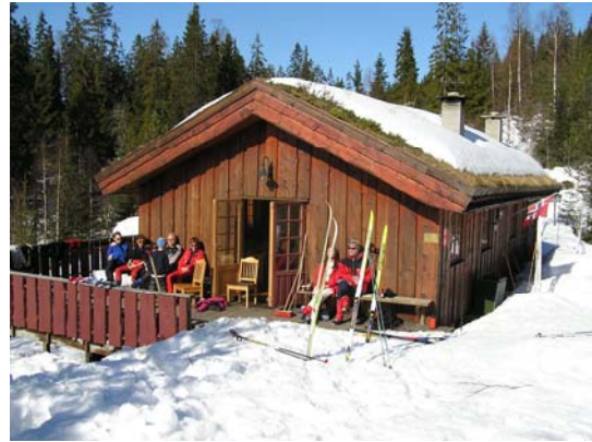
31. mars, flott skidag med appelsiner i sekken.