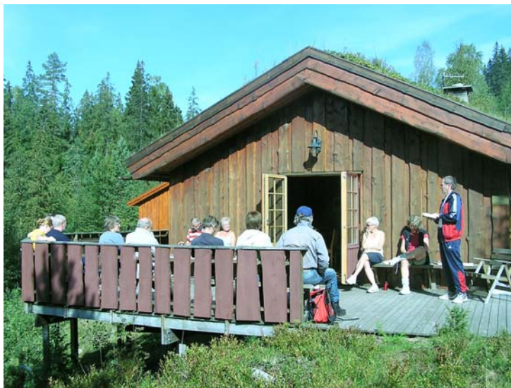
10. sept. var Kåre Ekroll andaktsholder. Været var nydelig så samlingen var ute på verandaen.