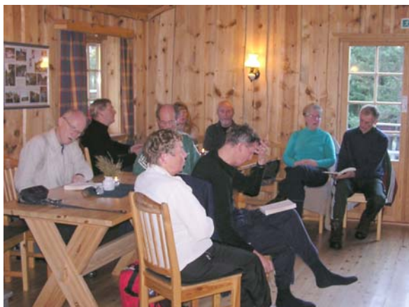
Gjestene deltar godt i fellessangen 12. nov.