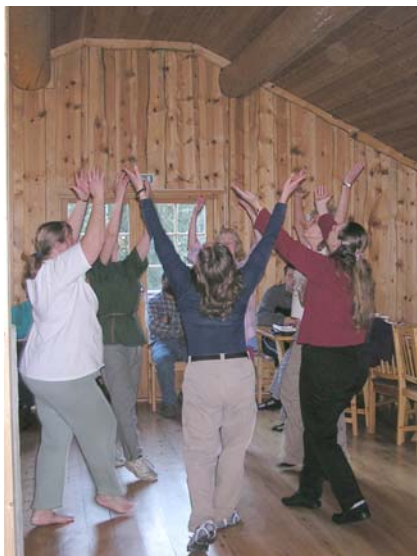
Emmanuel-gruppen viste frem fine bibelske danser ved andakten 12. nov.