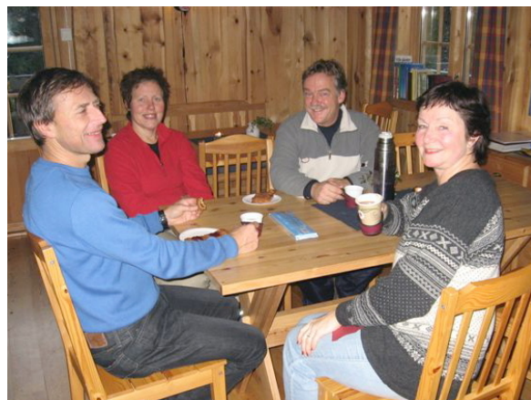
19. nov. var Siljeveien i Lørenskog godt representert!